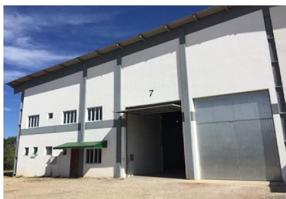
Galpão 7 - 2 portas em nível e uma doca na lateral